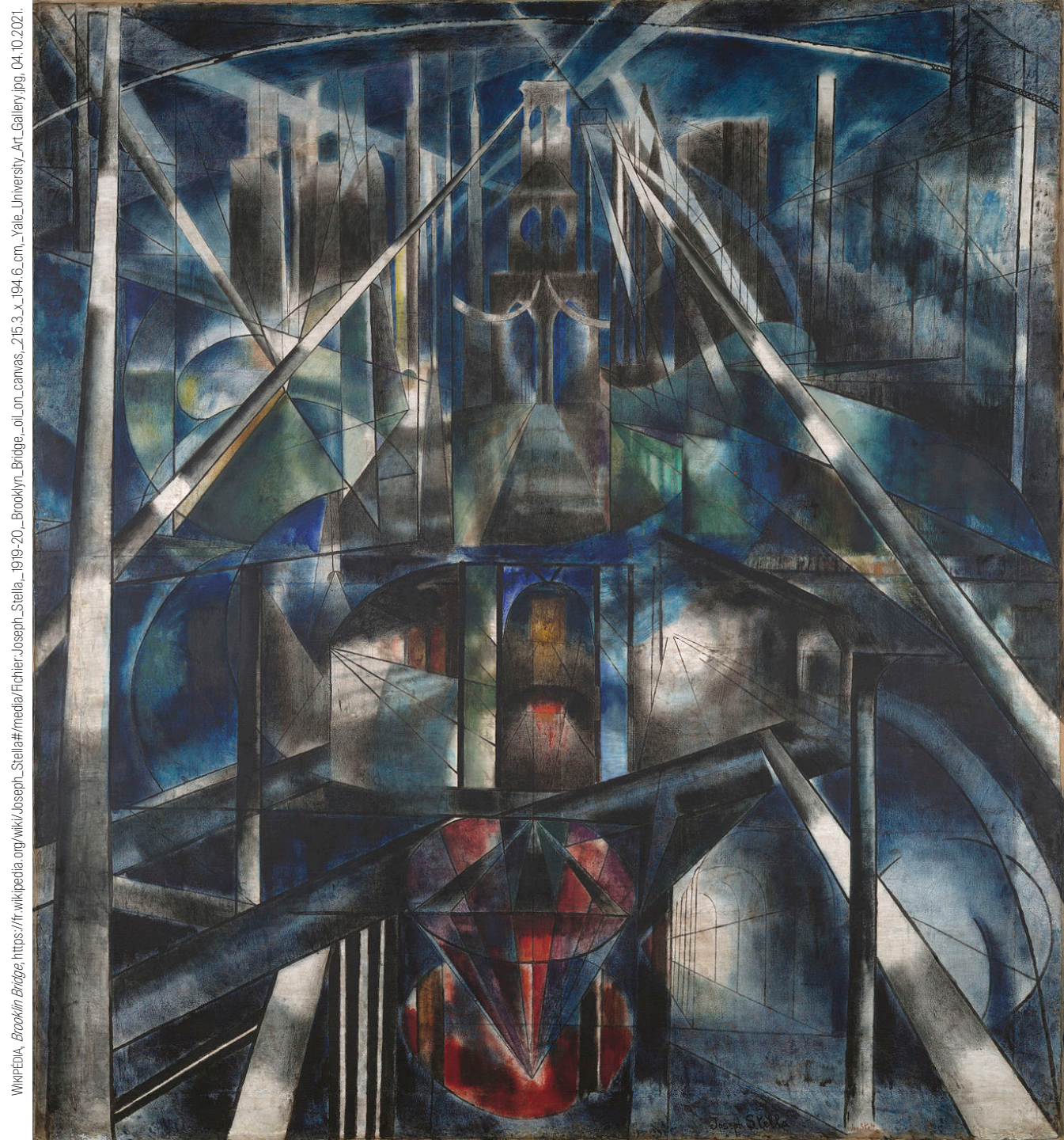
Brooklyn Bridge, https://fr.wikipedia.org/wiki/Joseph_Stella#/media/Fichier:Joseph_Stella,_1919-20,_Brooklyn_Bridge,_oil_on_canvas,_215.3_x_194.6_cm,_Yale_University_Art_Gallery.jpg, 04.10.2021.

2.3. Joseph STELLA, Brooklyn Bridge , Yale University Art Gallery, 1919-1920.