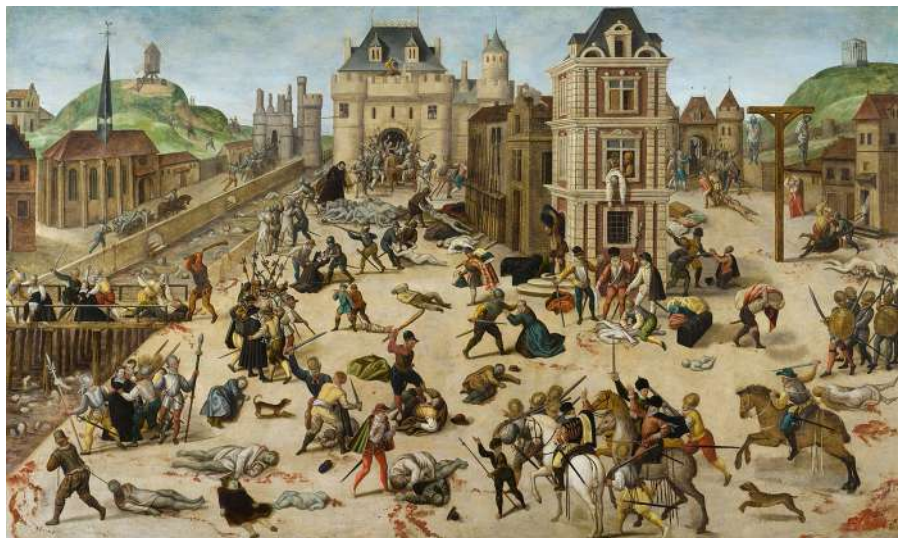
Wikipédia, Le Massacre de la Saint-Barthélemy de François Dubois; https://fr.wikipedia.org/wiki/Massacre_de_la_Saint-Barthélemy#/media/Fichier:La_massacre_de_San_Bartholomé_por_François_Dubois.jpg , 21.04.2020.