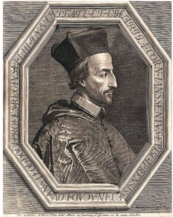
Wikipédia, Cornelius Jansen, https://fr.wikipedia.org/wiki/Blaise_Pascal#/media/Fichier:Cornelius_Jansen.jpg , 13.09.2020.