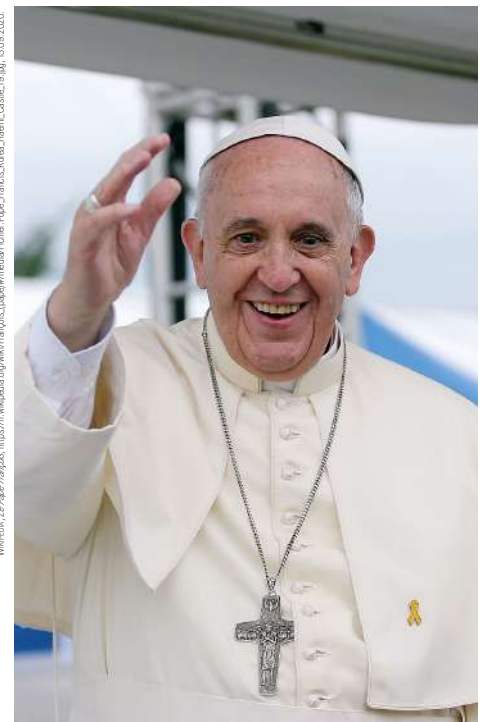
Wierzbna, Le Pape François; https://fr.wikipedia.org/wiki/François_(pape)#media:Fichier:Pape_Francois_Kono_Hiem_Cuetic19.jpg , 13.03.2020.