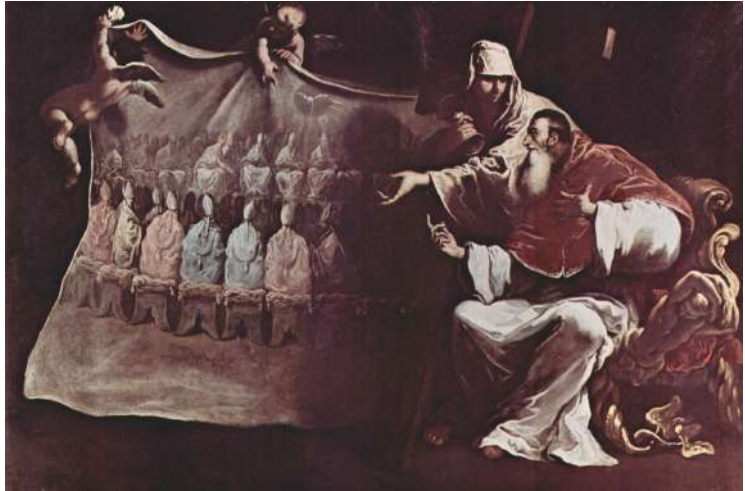
Wierzbna, Sebastiano Ricci, Paul III inspiré par la Foi pour convoquer le Concile de Trente