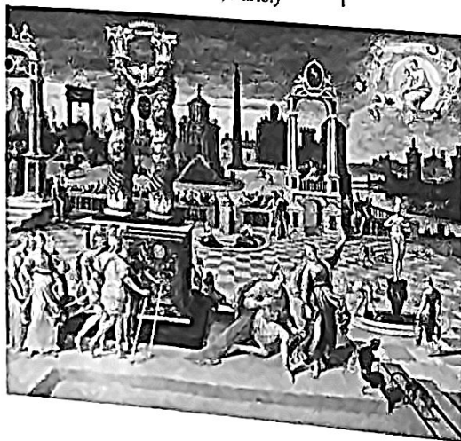
ANTOINE CARON (1521-1599), La Sibylle de Tibur (détail). (Musée du Louvre, Paris.)

bien un principe d'organisation du monde qu'une simple règle de vie, que tant inlassablement la vérité comme le fera Montaigne à la fin du siècle.