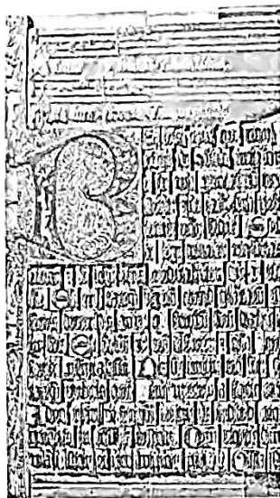
Plaque typographique imprimée par Gutenberg. (Musée Gutenberg, Mayence.)

L' humanisme cherche à retrouver la pureté des œuvres antiques, à les débarrasser des gloses médiévales, espérant par là trouver un savoir, voire une sagesse. Se distinguant du penseur médiéval, l'humaniste s'intéresse à l'homme, dont il fait l'objet ultime de sa quête. Il s'agit de réconcilier l'homme avec lui-même, avec son corps, de lui dire que la faute originelle n'est pas nécessairement source de maux éternels et qu'il possède en lui une part de liberté inaliénable. En un temps où l'on brûle un homme pour peu de chose, l'humaniste lutte contre tous les fanatismes, contre la torture et les mauvais traitements judiciaires, faisant ainsi l'éloge de la dignité humaine. C'est en se référant à la nature, à sa beauté et à son harmonie, que les humanistes méditent aussi