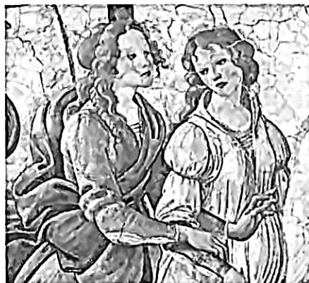
SANDRO BOTTICELLI (≈ 1445-1510), Vénus et les Grâces offrant des présents à une jeune fille (détail). (Musée du Louvre, Paris.)

Baïf en 1514 ; les écrivains un peu plus tard : Rabelais, Marot, Du Bellay...). Mais les Italiens sont aussi nombreux à se rendre en France, invités par François I er notamment. Des artistes et des ingénieurs apportent ainsi leur savoir-faire. Le plus célèbre d'entre eux, Léonard de Vinci, passa à Amboise, aux côtés du roi, les dernières années de sa vie. L'esprit de la Renaissance italienne commence alors à imprégner lentement la création artistique française : l'architecture dès le début du XVI e siècle avec le château de Chambord, en partie conçu par Léonard, et celui de Chenonceaux ; la littérature avec le Courtisan de Castiglione, qui offre à la cour un nouveau modèle de vie. Dans l'enthousiasme, les futurs poètes de la Pléiade découvrent Pétrarque.