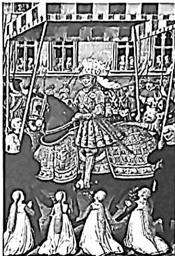
Entrée de Louis XII à Gênes, extrait du Voyage de Gênes, par Jean Marot.

Le rêve italien n'est pas seulement rêve de conquête. Les élites de la société française succombent très vite aux charmes de la culture italienne , à son apogée au cours du XV e siècle (le Quattrocento). Florence, puis Rome et Venise sont les grands pôles artistiques qui fascinent et attirent penseurs et artistes (Guillaume Budé dès 1501, Lazare de