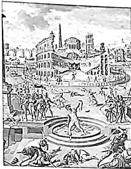
ANTOINE CARON, Les Massacres du Triumvirat , 1566 (détail). (Musée du Louvre, Paris.)

L'éventail des richesses ne cesse de s'ouvrir au cours de la Renaissance. Mais l'existence d'une classe moyenne de roturiers (c'est-à-dire de non-nobles), « vilains » à la campagne et surtout bourgeois des villes, n'a guère de poids vis-à-vis d'une aristocratie qui tend à se refermer sur elle-même et cherche des occasions de paraître et de se distinguer des classes inférieures. Ses privilèges demeurent très importants : privilèges de justice, exemption de taille, de corvées personnelles, d'impôt territorial,