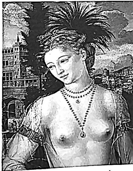
JAN MASSYS (≈ 1509-≈ 1575), Bethsabée et David (détail). (Musée du Louvre, Paris.)

Montaigne, comme tous les écrivains de son temps, se montre sensible au mouvement. Cette vision d'un monde instable, en proie à des forces antagonistes, donne naissance à un art fondé sur les jeux de la métamorphose et le brio des images. Sous l'appellation de baroque (☞ p. 188), on regroupe les artistes, souvent méconnus, des dernières décennies du XVI e siècle et des premières du siècle suivant. Le néoplatonisme (☞ p. 134) et la poésie amoureuse de Desportes préfigurent la préciosité du XVII e siècle. Tout autre est l'ambition d'Agrippa d'Aubigné dans Les Tragiques (1616). Loin de prétendre faire œuvre d'historien avec ce long poème en sept chants, d'Aubigné entend plutôt donner à l'aventure de l'Église pro-